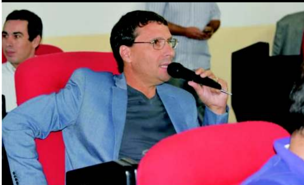
EN SAN MIGUEL LA PORTA PIDE CONTROL PRESUPUESTARIO