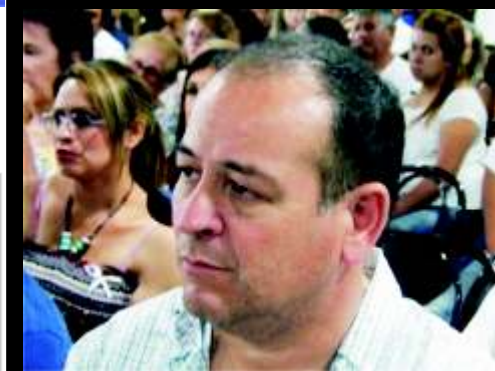
RECLAMAN AL INTENDENTE DE SAN MIGUEL POR FONDO EDUCATIVO NACIONAL