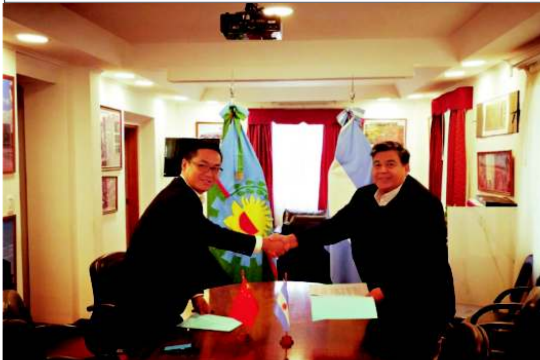
HISTÓRICO: JOSÉ C. PAZ TENDRÁ PLANTA CHINA PARA TRATAR RESIDUOS