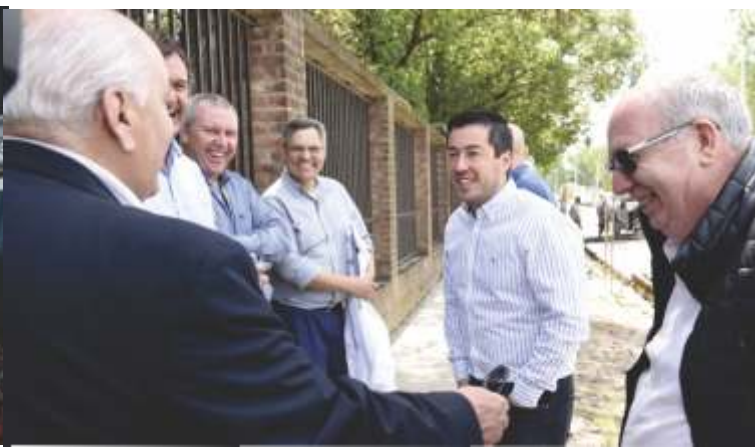
UN TRABAJO CONJUNTO PARA PAVIMENTAR LA CALLE COSTA RICA DE MALVINAS ARGENTINAS