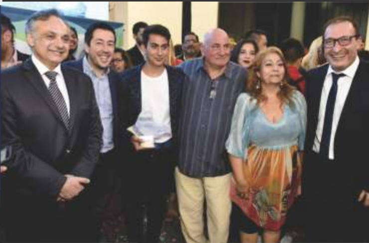
POR INICIATIVA DEL SENADOR VIVONA LA CÁMARA ALTA PREMIÓ A E.T. N° 1 DE GRAND BOURG