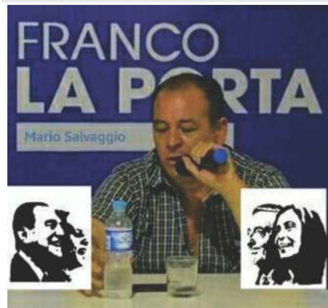
CONSEJERO ESCOLAR DE SAN MIGUEL RECLAMA POR DEFICIENTE SERVICIO ALIMENTARIO ESCOLAR