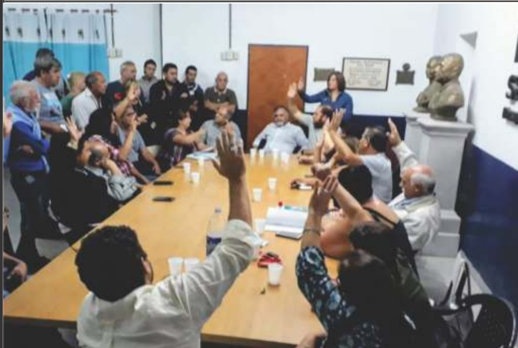
EN SAN MIGUEL EL PJ VOTÓ TRABAJAR POR LA LISTA DE UNIDAD DESBARATANDO MANIOBRA DE CAMBIEMOS