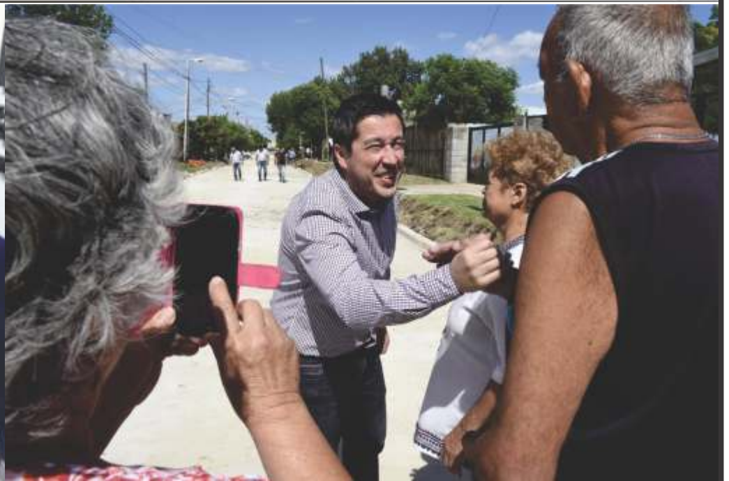
MALVINAS ARGENTINAS AVANZA EN OBRAS DE PAVIMENTO E HIDRÁULICA EN LA GESTIÓN NARDINI