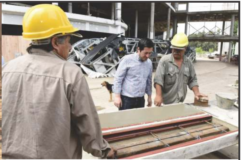
SE INTENSIFICA CONSTRUCCIÓN DEL HOSPITAL UNIVERSITARIO DE DIAGNÓSTICO PRECOZ EN MALVINAS ARGENTINAS