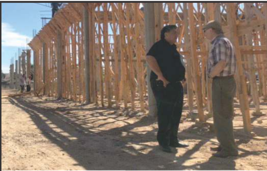
AVANZA LA OBRA DE LA FACULTAD DE MEDICINA EN JOSÉ C. PAZ