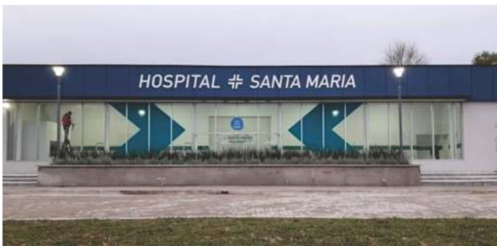
NUEVO HOSPITAL SANTA MARÍA NO TIENE INTERNACIÓN NI TERAPIA INTENSIVA