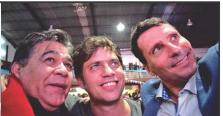
FRANCO LA PORTA PRESENTÓ SU PROGRAMA DE GOBIERNO PARA SAN MIGUEL ACOMPAÑADO POR KICILLOF Y NUMEROSOS INTENDENTES