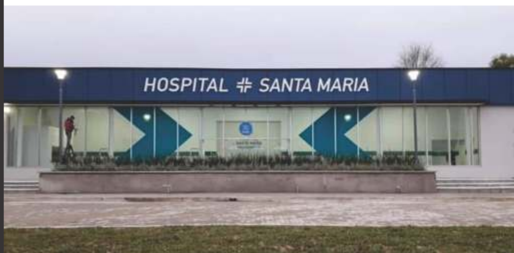
EL NUEVO HOSPITAL SANTA MARÍA NO TIENE INTERNACIÓN NI TERAPIA INTENSIVA. TE DERIVAN AL LARCADE