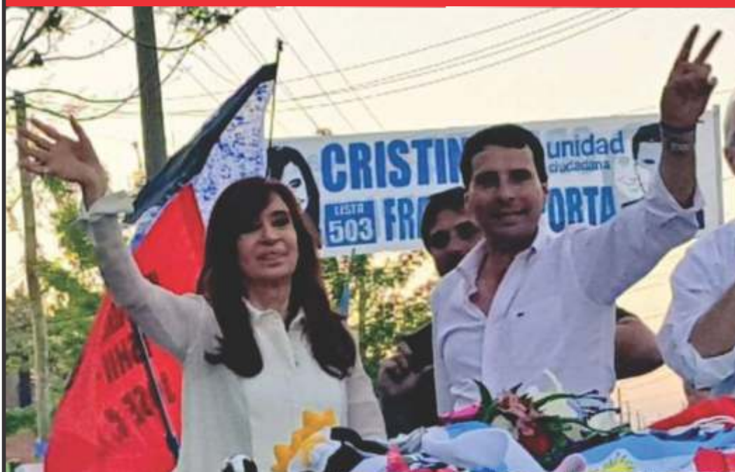
LOS TRIUNFOS EN OCTUBRE DE FERNÁNDEZ Y KICILLOF SON IRREVERSIBLES. SAN MIGUEL NO PUEDE QUEDAR AISLADO