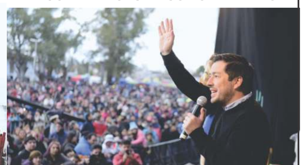
EN EL LUGAR DE LA FAMILIA CON 100.000 PERSONAS FESTEJANDO EL DÍA DEL NIÑO COMO SOLO MALVINAS ARGENTINAS SUELE HACERLO