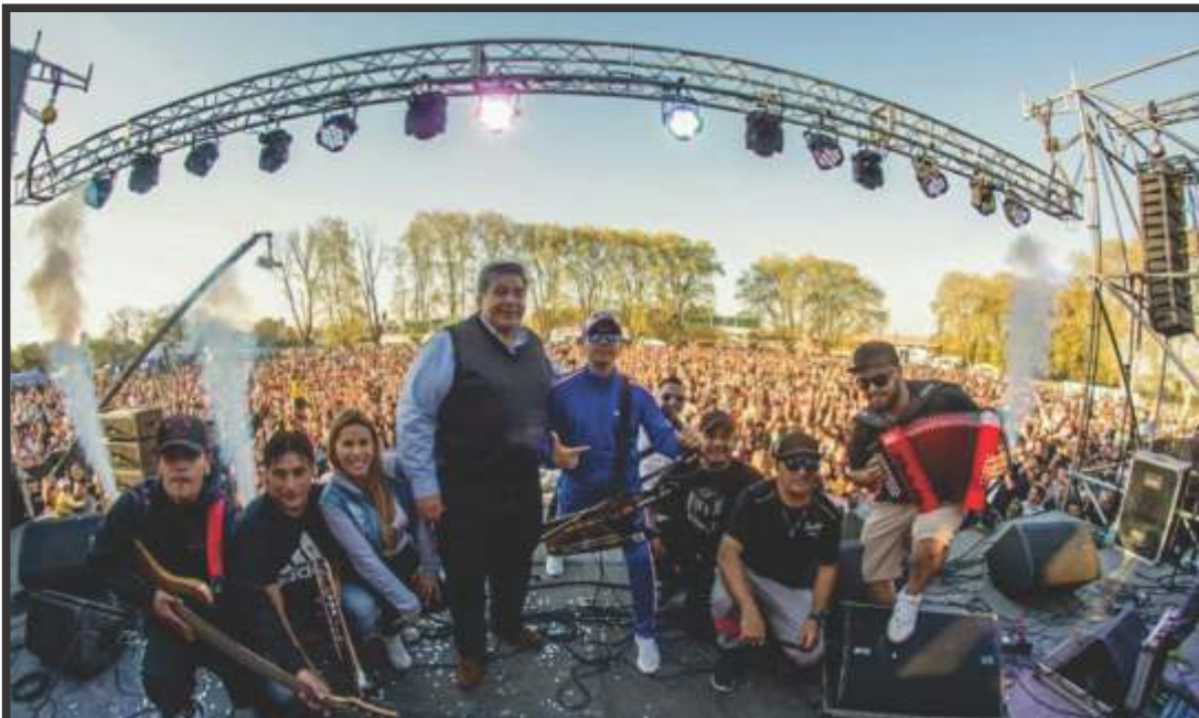
EN JOSÉ C. PAZ MULTITUDINARIO FESTEJO DE LA PRIMAVERA CON DAMAS GRATIS Y GRAN SHOW MUSICAL