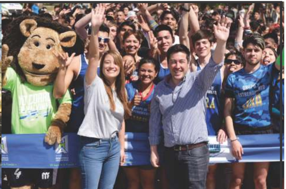
DÍA DE LA PRIMAVERA EN MALVINAS ARGENTINAS #ElLugarDeLaFamilia CON LA CARRERA DE LOS COLORES Y MÚSICA