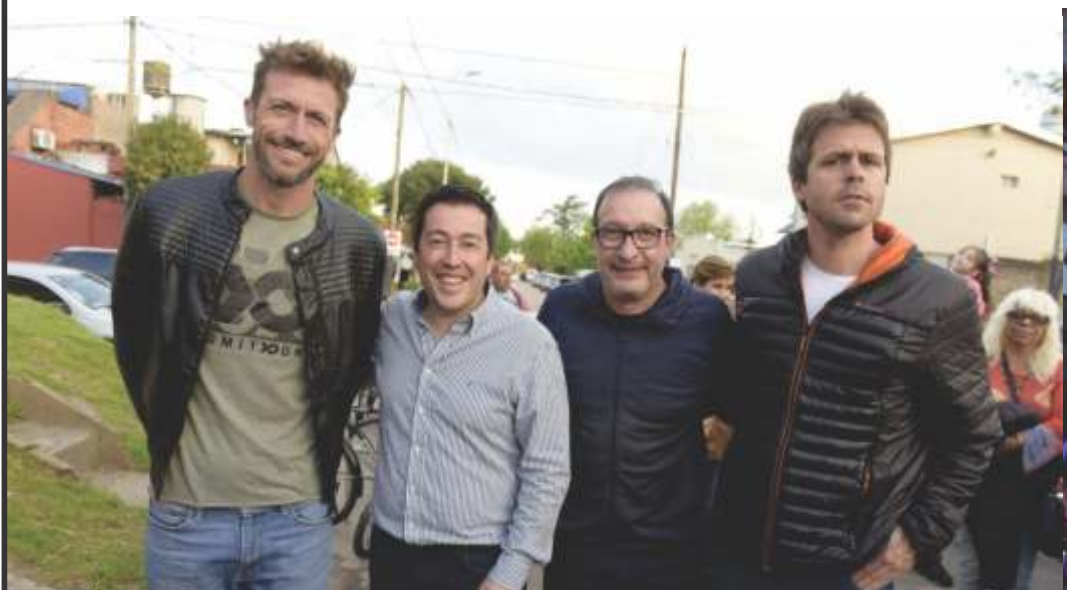
EN VILLA DE MAYO TAMBIÉN PASAN COSAS BUENAS Y EL INTENDENTE NARDINI LAS MUESTRA