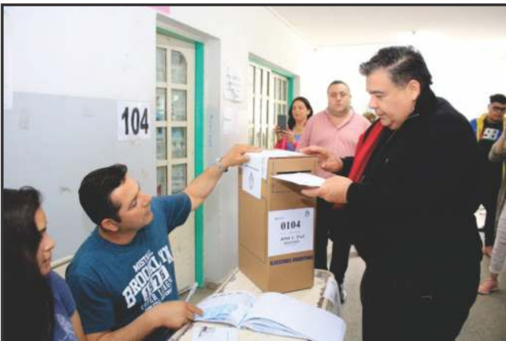
MARIO ISHII AVASALLÓ A CAMBIEMOS EN JOSÉ C. PAZ Y CONSOLIDÓ ELECTORALMENTE A ALBERTO, CRISTINA Y AXEL