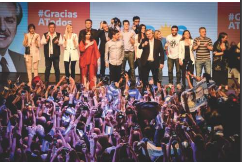
TODOS LOS DATOS DE LA JORNADA ELECTORAL DE LA REGIÓN EN PAGINA 3