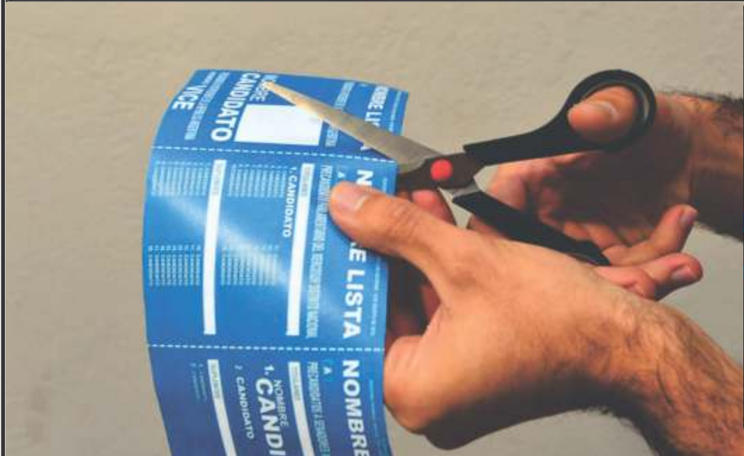
EN SAN MIGUEL GANO UNIDOS POR EL CORTE