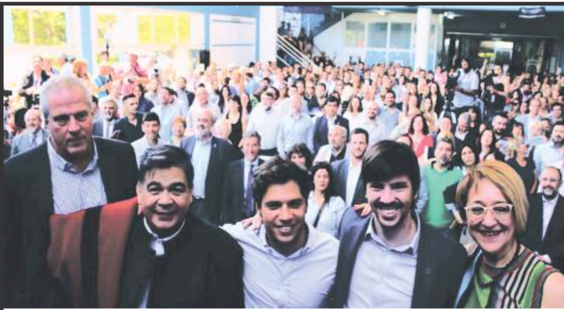
JORNADA EN LA UNPAZ CON KICILLOF E ISHII CELEBRANDO 70° ANIVERSARIO DE LA GRATUIDAD UNIVERSITARIA