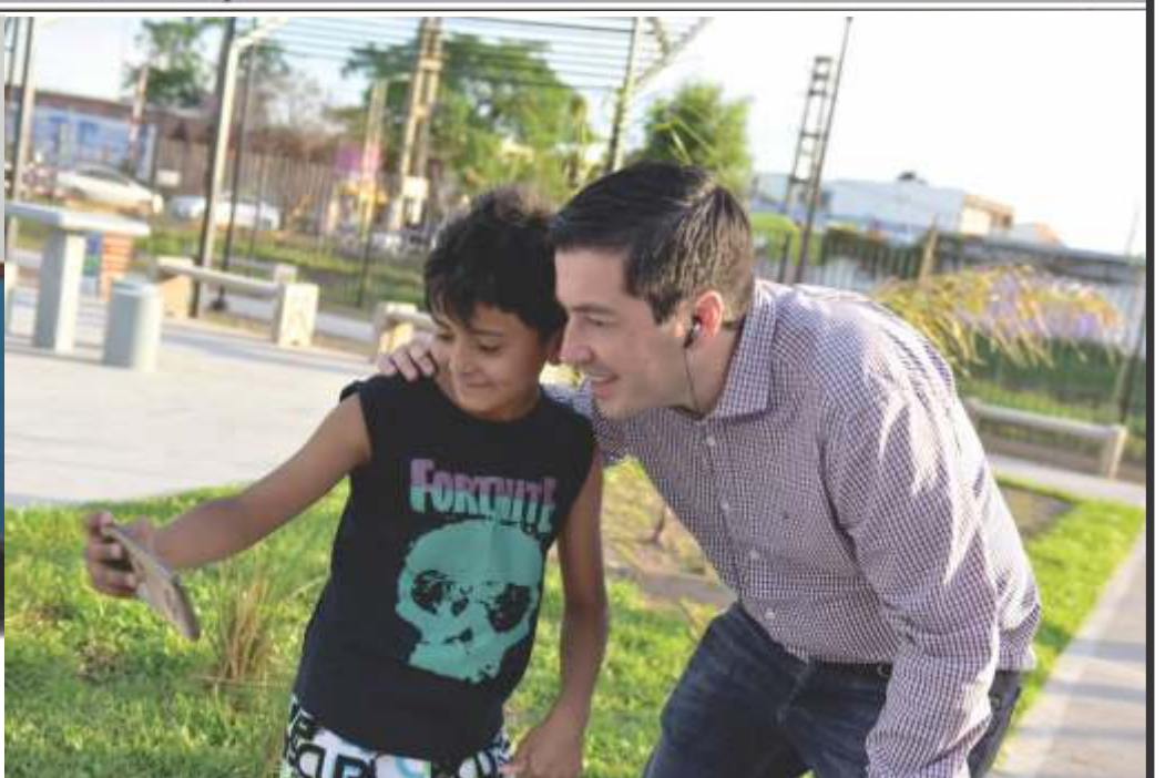
NUEVA PLAZA JUNTO A ESTACIÓN LOS POLVORINES QUE PUEDEN DISFRUTAR LAS FAMILIAS