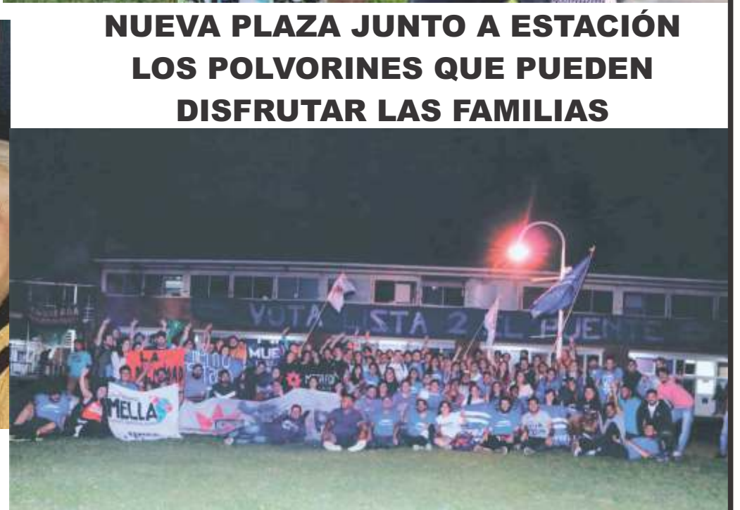
EN LA UNGS EL PUENTE SE IMPUSO POR AMPLIO MARGEN Y CONQUISTA EL CENTRO DE ESTUDIANTES QUE MANEJABA EL TROSQUISMO