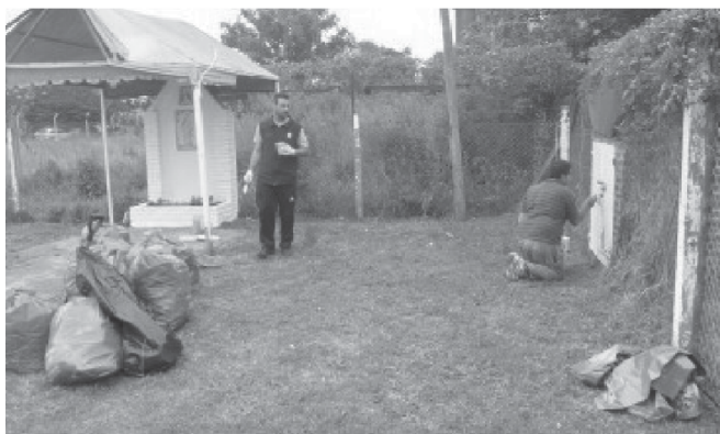
lugar de recreación y esparcimiento como quiere el Intendente.

Desde el municipio, está prevista la realización de 400 playones deportivos en los diferentes barrios del distrito, como iniciativa para mejorar los mismos y darles a los jóvenes un