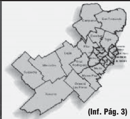
(Inf. Pág. 3)