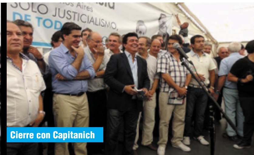
Cierre con Capitanich

Este sábado 22, en Santa Teresita, Partido de la Costa, la conducción provincial del Partido Justicialista convocó a un Encuentro de Reflexión y Debate, que se desarrolló en numerosas comisiones (de Economía, Producción, Servicios Públicos, Seguridad, Mujer, Juventud y otros), en carpas ubicadas en el predio del Club de Golf local. Nuestro medio, único representante de la prensa zonal, recorrió los ámbitos de debate y registró los resultados.