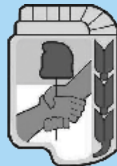
Presidente del Partido Justicialista de José C. Paz