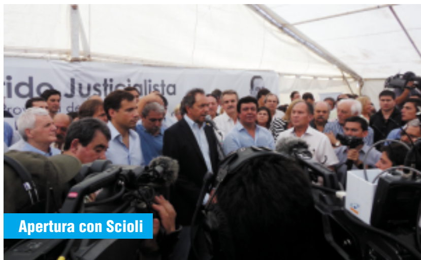
Apertura con Scioli

Amplio apoyo a la presidente Cristina de Kirchner y convocatoria para el 1º de marzo.