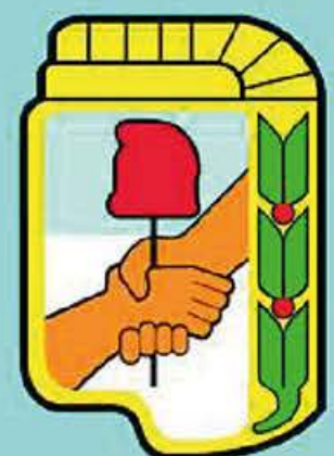
Presidente del Partido Justicialista de José C. Paz