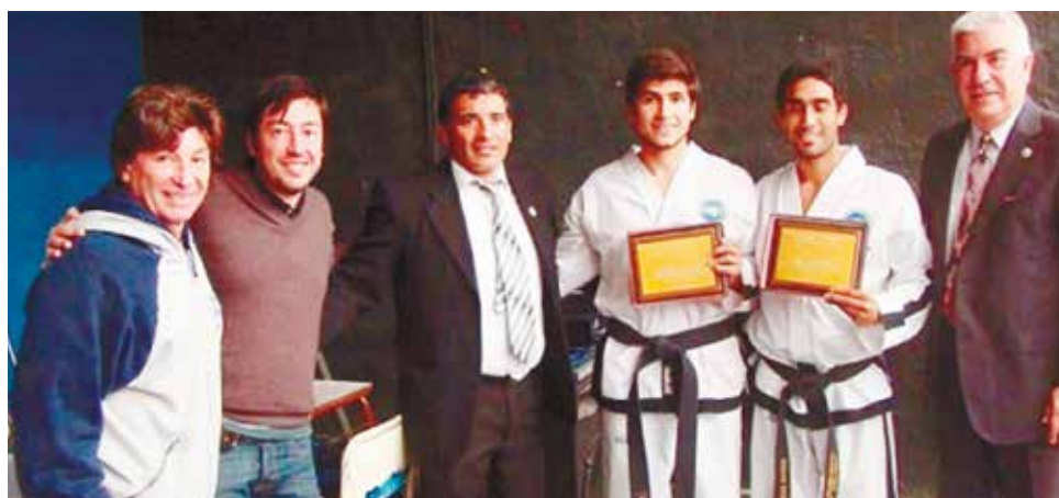
Nuevamente la EEM N° 7 de Tortuguitas fue la sede para la 8va. edición del Taekwondo Open de Malvinas Argentinas, en dónde participaron más de 300 personas desde 4 a 35 años de diferentes puntos de la provincia de Buenos Aires.

La competencia estuvo dividida en diferentes categorías entre ellas: Exhibiciones para los niños y niñas de cuatro y