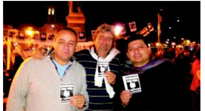
para acompañar este reclamo universal por los derechos humanos, siendo la única actividad registrada en San Miguel el día de la convocatoria general.