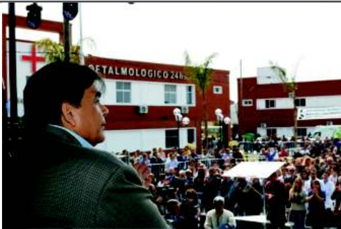
ISHII EN JOSE C. PAZ CON TRIUNFAZO EN LAS PASO E INAUGURACIÓN DE 5° HOSPITAL