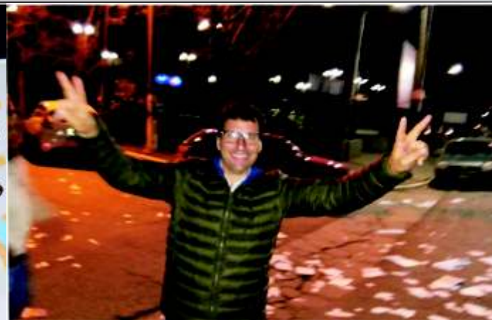
TRIUNFO DE LA PORTA QUE SE AFIANZA COMO LÍDER DE LA OPOSICIÓN EN SAN MIGUEL