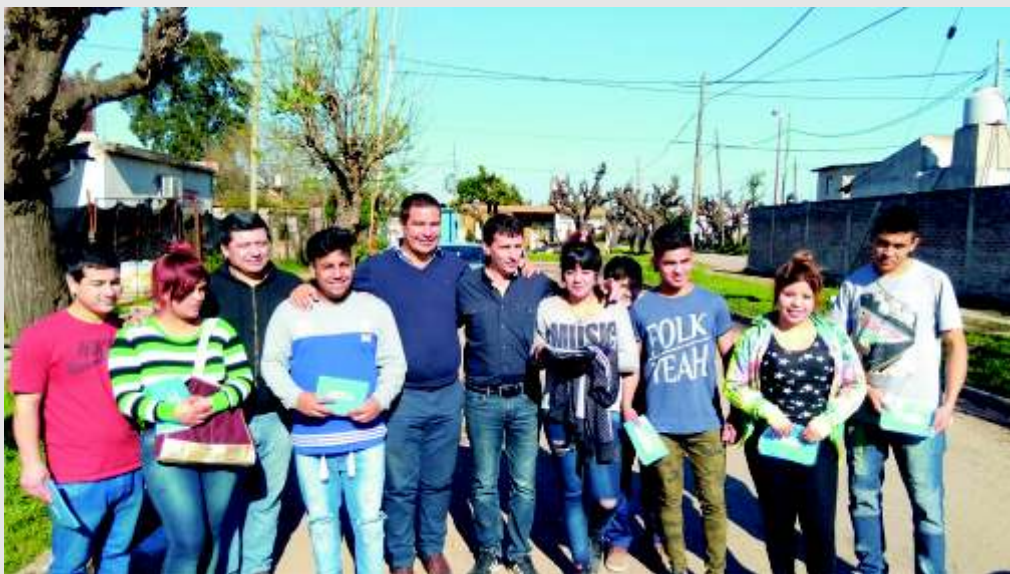
Ciudad Santa María (ex San Miguel Oeste), con la necesidad de contar con un hospital

Hubo temas como el trabajo, la carestía de la canasta familiar y la inseguridad, que se repitieron frecuentemente. Vecinos albañiles que han visto perderse las changas y verse obligados a bajar los precios para tratar de conseguir trabajo. Otros vecinos con trabajo pero que tienen hijos sin posibilidad de acceder al primer empleo. La falta de un sistema de salud en