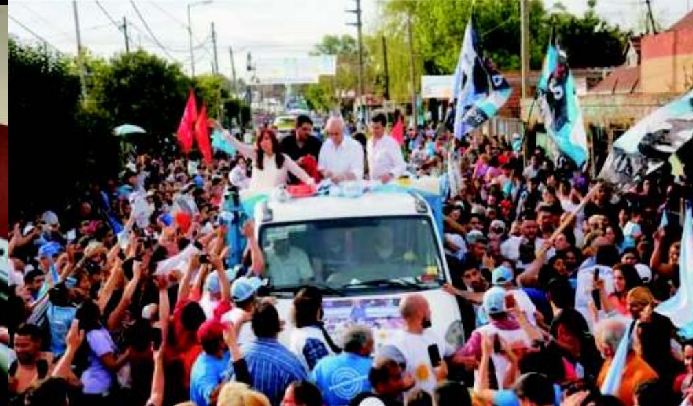
CON 37,2 % DE LOS VOTOS CFK ES LA LÍDER DE LA OPOSICIÓN A CAMBIEMOS