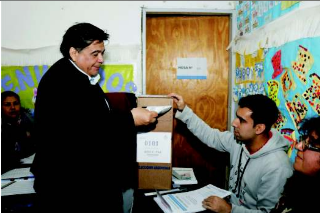
ISHI GANÓ CON UC Y PRIMER OPERACIÓN DE TUMOR HAIFU