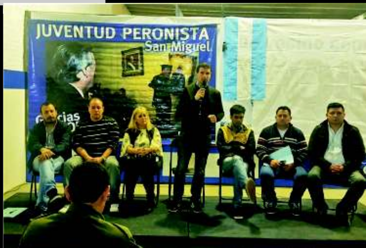
EL PERONISMO DE SAN MIGUEL QUIERE RECUPERAR EL PJ USURPADO POR CAMBIEMOS Y LA TRAICIÓN