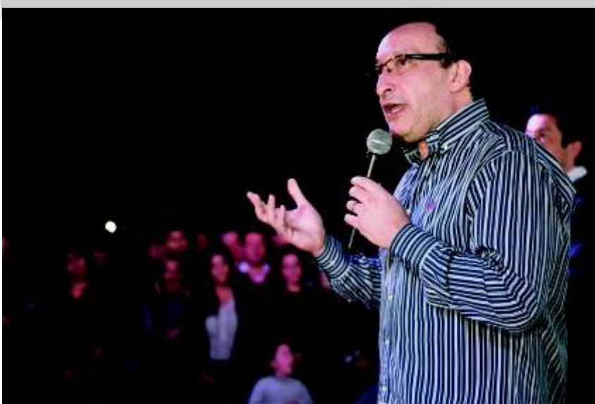
LUIS VIVONA ELECTO SENADOR PROVINCIAL