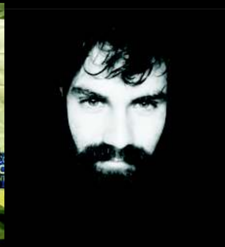
RESPECTO, VERDAD Y JUSTICIA