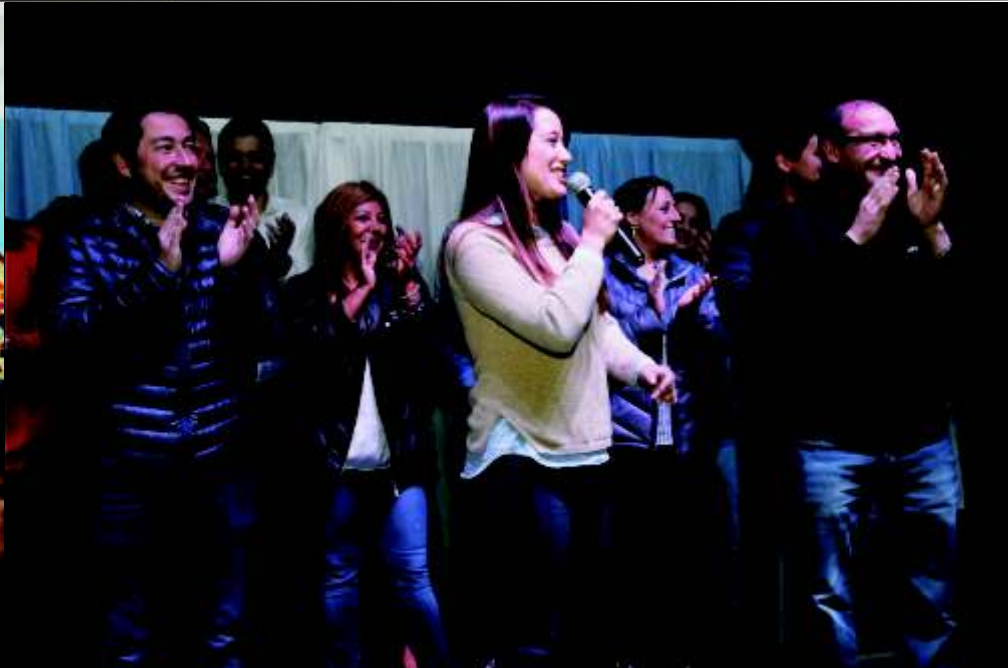
EN MALVINAS ARGENTINAS SALIÓ EL SOL