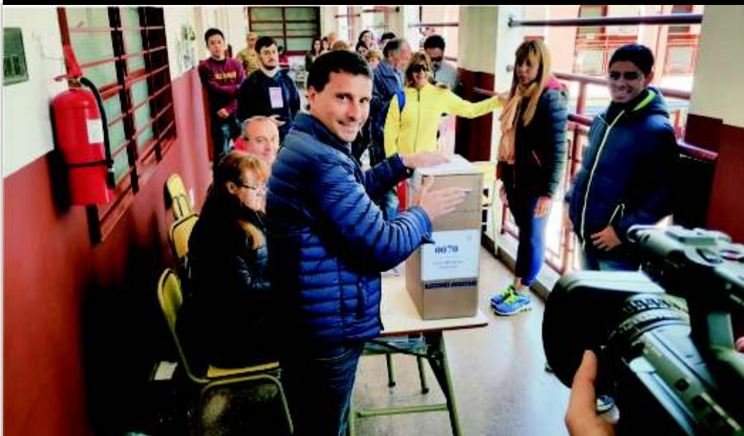
LA PORTA CONSOLIDA SU LIDERAZGO DE OPOSICIÓN A CAMBIEMOS SAN MIGUEL